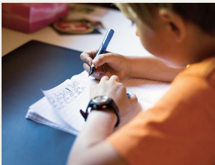
C'est l'heure des devoirs pour Mathieu.

Si le quotidien reste gérable malgré tout, c'est grâce aux grands-parents. «Pour nous, ils sont d'une très grande aide et leur présence est un enrichissement pour nos garçons.» Les parents de Joël aussi bien que ceux de Christelle sont pleinement mis à contribution dans la garde des enfants. Chaque couple s'occupe d'eux un jour par semaine, soit pour les accueillir en milieu d'après-midi lorsqu'ils rentrent de l'école, soit toute la journée en période de vacances scolaires. Un accueil parascolaire existe à Vissoie. Il permet aux enfants de rester à l'école jusqu'en début de soirée. «Mais la structure manque de souplesse, les changements de dernière minute sont exclus pour des raisons d'organisation», glissent Joël et Christelle, qui ont décidé de ne pas profiter de ce service. «A l'inverse, nos parents peuvent nous dépanner à n'importe quel moment, par exemple quand un de nos fils tombe malade.» Cette souplesse est d'une importance particulière pour Christelle, qui n'a droit qu'à trois jours de congé pour enfant malade par année, qui plus est sur présentation d'un certificat médical.