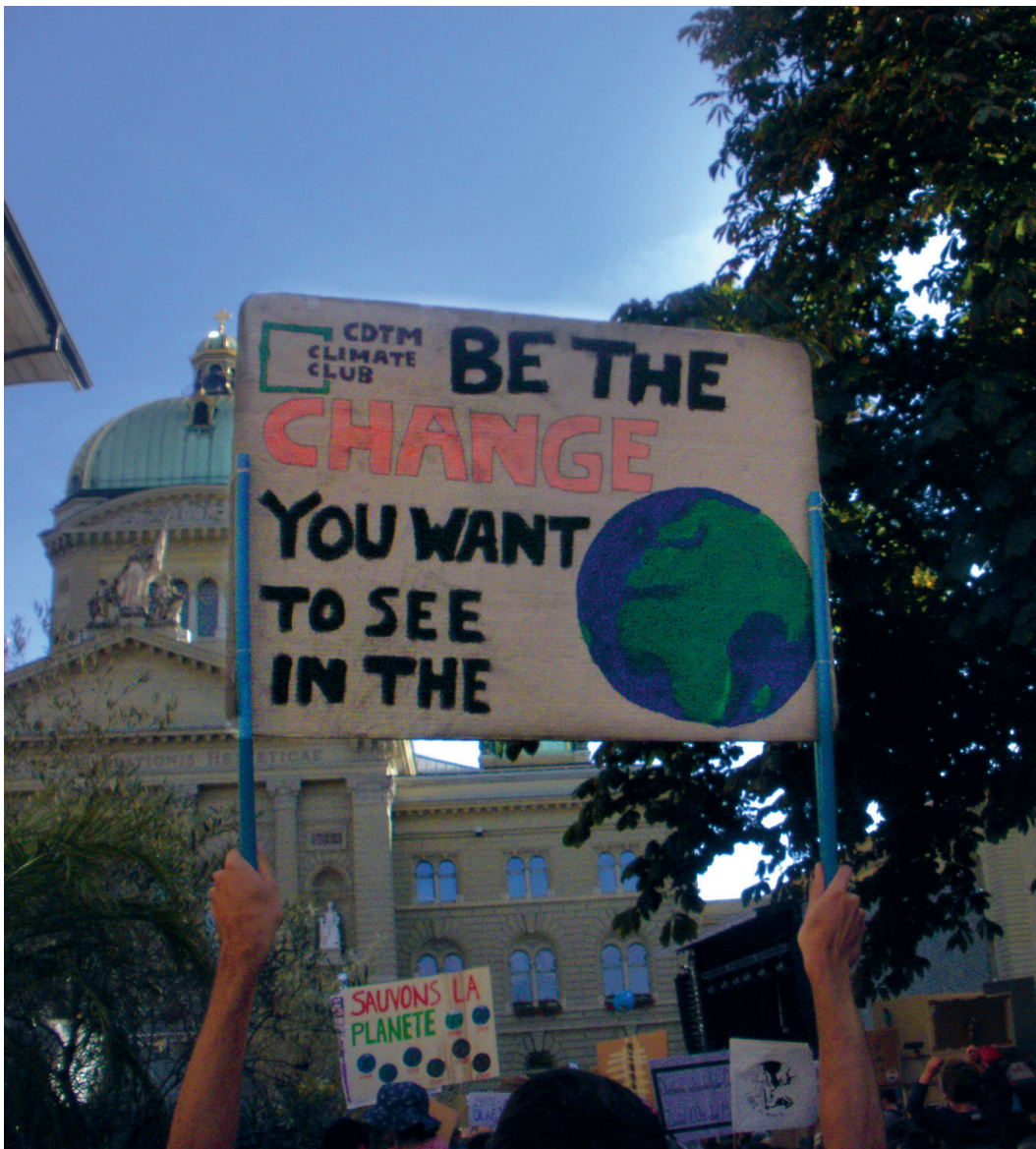
Manifestation pour le climat, Berne, 28 septembre 2019.

qui les sous-tendent. Développé initialement par Theodor Schatzki 3 et précisé par Daniel Welsh et ses collègues 4 , le concept de structures téléoaffectives vise à décrire le fait que toute pratique porte en elle une orientation vers un but et des objectifs, liée à des sentiments et des croyances, et qu'elle se construit donc à partir d'une certaine projection dans le futur.