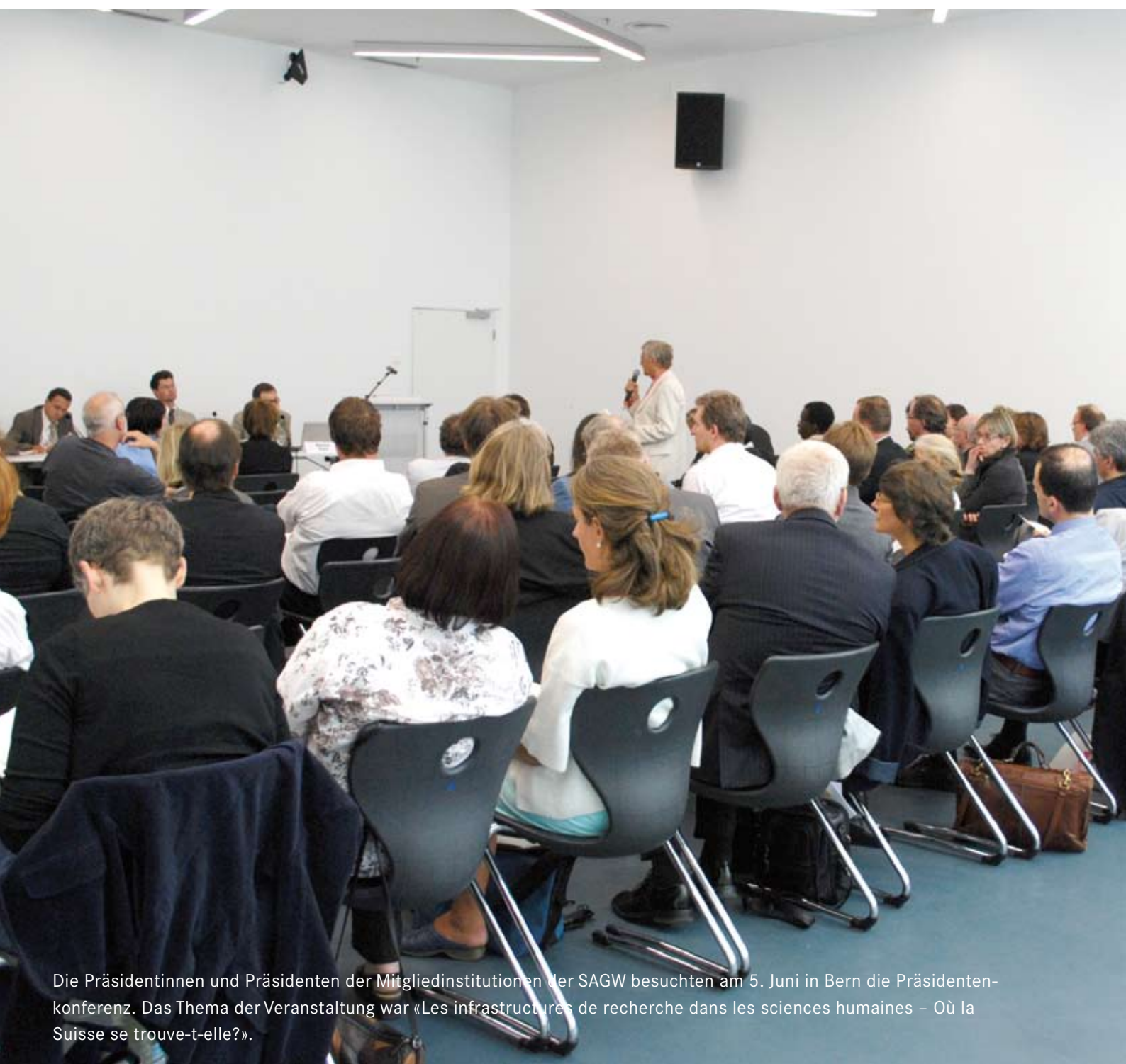
Die Präsidentinnen und Präsidenten der Mitgliedsinstitutionen der SAGW besuchten am 5. Juni in Bern die Präsidentenkonferenz. Das Thema der Veranstaltung war «Les infrastructures de recherche dans les sciences humaines – Où la Suisse se trouve-t-elle?».

http:// Les rapports annuels de toutes les sociétés membres, entreprises, commissions et tous les conseils: www.assh.ch/rapport-annuel