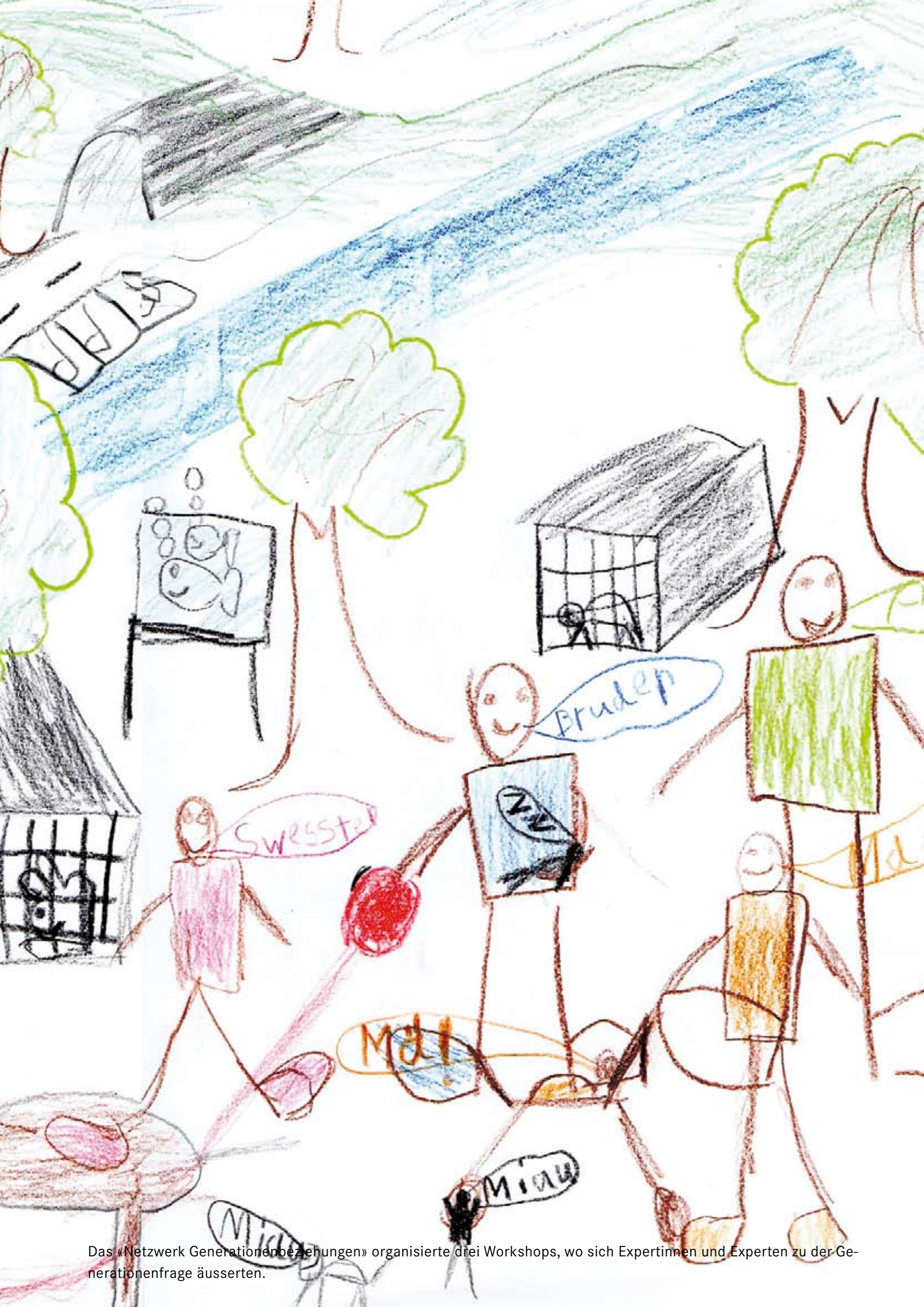
Das «Netzwerk Generationenbeziehungen» organisierte drei Workshops, wo sich Expertinnen und Experten zu der Generationenfrage äusserten.